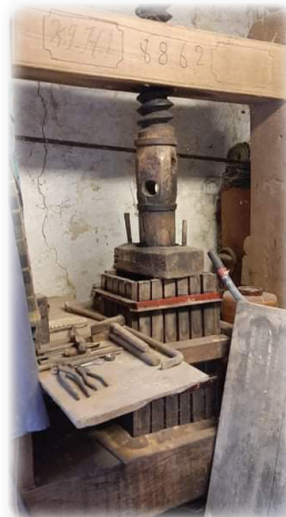
Gergely Gábor tulajdona, 1882-ben készült