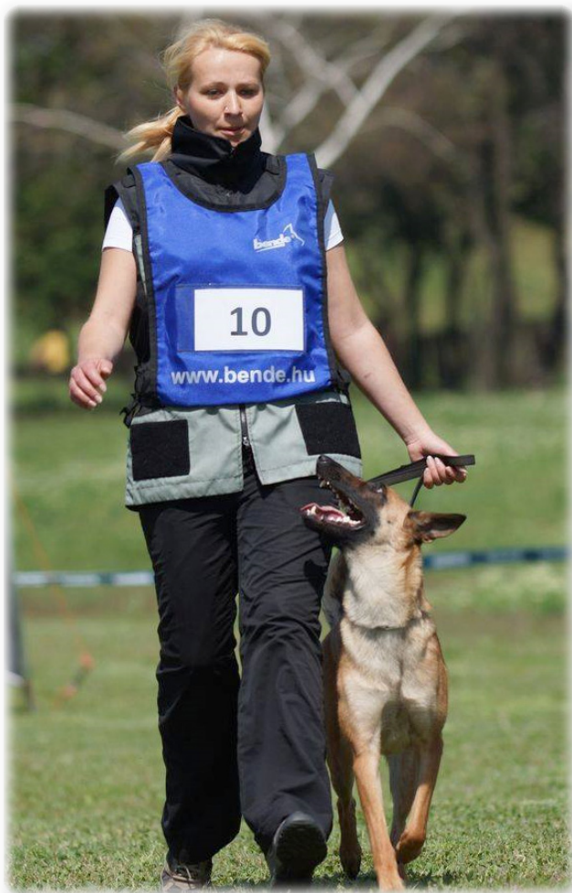
2. kép Anka engedelmes munka közben

Ez a sportág már nem minden kutyafajtának ajánlott, hiszen ez kimondottan munkakutyák számára hozták létre. Maga a sport az IPO (Internationale Prüfungsordnung) és ez egy szigorú és összetett teljesítményrendszer, ami három különböző ágazatot ölel fel, az engedelmes, az őrző-védő és a nyomkövető ágazatokat. A IPO –t három képzettségi szintre osztják, a legmagasabb az IPO III –s, amely eléréséhez több év képzése és gyakorlása szükséges, hiszen mindhárom ágazatban teljesíteni kell a kutyának. Az ágazatokat 100 pontig bírálják egy szigorú szabályzat alapján, 70 pontot kell elérni a megfelelő szintig.