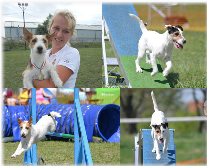
1.kép Tyson és Molly Agilitiy közben

Tyson és Molly már 6 éve űzik ezt a sportot, és kelő felkészülés után versenyeken sikeresen részt vettek, Tyson felevezetője párom, Molly aki egészen jól alkalmazkodik bárkihez sokszor gyermekemmel is együtt versenyzett, vagy velem. Többször értünk el dobogós helyezéseket, de legjobb eredménye Tysonnak Országos Bajnokságon 5. helyezés volt.