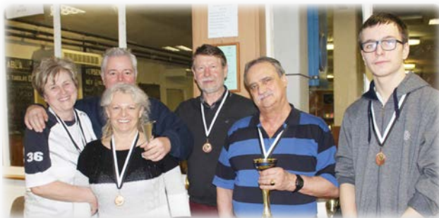
Rettenthetetlenek - 3. hely