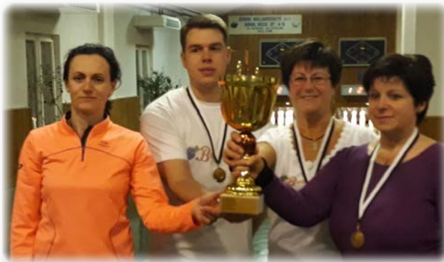
Borbarátnők - 1. hely