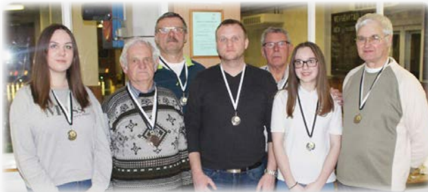
Kertbarátok - 2. hely