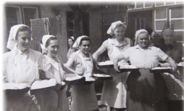
Sárísápi asszonyok a lakodalomra előkészített bejglikkel

Háromszor hirdették az esküvőnket a templomban. Mindkettőnknek ott kellett lennünk. Azt mondták, hogy akik nem