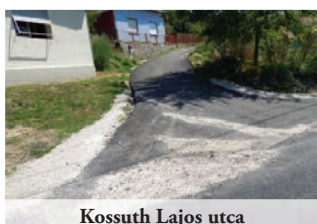
Kossuth Lajos utca