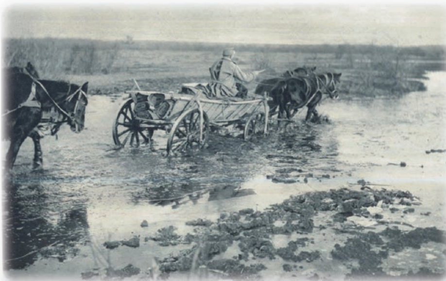
A rokitnói mocsarak mélyén

Később a hadifogságban a papa megtanult kosarat fenni. A hadifoglyok fonták a kosarat és eladták krumplicsért – aki nem tudott fenni, az vitte a piacra árulni – az volt nekik a lágerkoszt kiegészítés.”