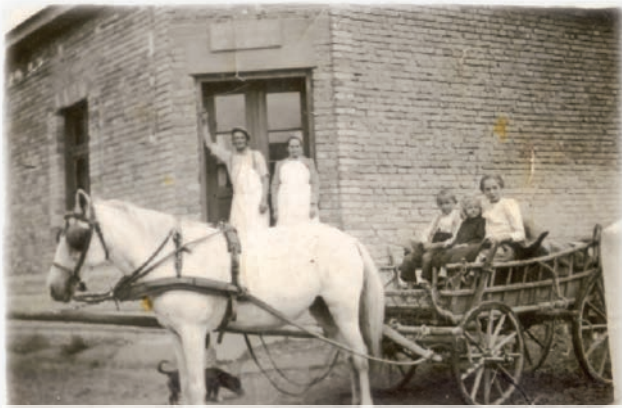
Kanóczki Pékség, Fő utca

Akkoriban a kemencék még fa- vagy széntüzelésűek voltak, melyeket a sütés előtt felfűtöttek. A megfelelő hőfok elérése után a paraszt kivették, majd egy csuhéból készült