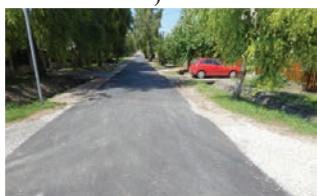
Arany János utca

Az elmúlt hetekben sikerült több utca aszfaltburkolatát megújítanunk az „adósságkonszolidációban nem érintett önkormányzatok” belügyminisztériumi pályázatából. Közel 60 millió forintból megújult az Arany János utca, a Diófa utca, a Vár utca, a Kossuth Lajos utca teljes szakasza, valamint az Epöli utcában, az Iskola közben, a Csaposkút utcában, valamint a Pincesor utcában útburkolati felújítási munkákat végeztünk. A Szabadság tér és az iskolaudvar új díszkő burkolatot kapott.