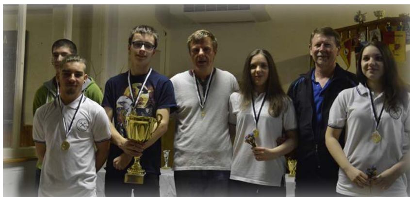
I. helyezett csapat - Tekeforever