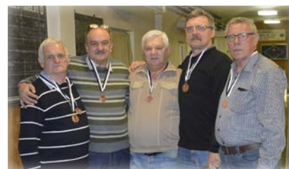
III. helyezett csapat – Kertbarátok csapata