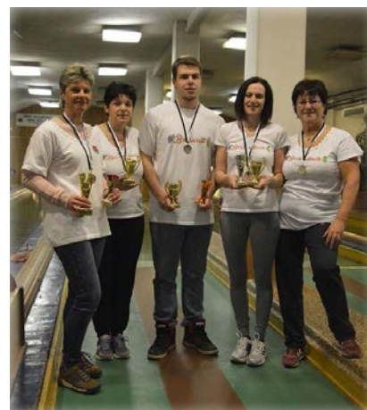
II. helyezett csapat - Borbarátnők