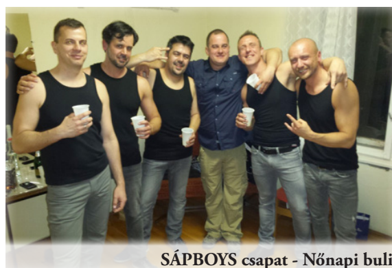
SÁPBOYS csapat - Nőnap buli