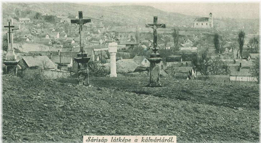
Sárísáp látképe a kálváriáról.

S megérkezünk nagyszombathoz. Jézus állhatatosságával, és irántunk érzett végtelen szeretetével lebontotta azokat a borzalmas akadályokat, amelyeket az emberiség bűne