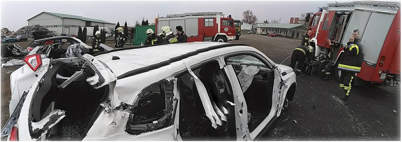
A kép a roncsvágási gyakorlaton készült.