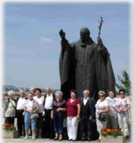
A várfalakon belül a II. János Pál pápáról elnevezett téren a püspöki palota gótikus tornyai emelkednek a kéklő ég felé.

A rövid, de emlékezetes városnézés után a rendezvény helyszínére indult a csapat, ahol már meleg szeretettel, és forró gulyással vártak a szervezők. A barátságos, vidám találkozót zoboralji népviseletbe öltöztetett babák, és izsai népi textíliák kiállítása tette színesebbé. A látnivalók mellett bemutakoztak a környék kézművesei is, ahol a kosárfonás alapjaival lehetett megismerkedni. S hogy a torok se maradjon szárazon arról a Kadarka Férfi Éneklőcsoporthoz tagjai gondoskodtak, akik a saját boraikat hozták el bemutatásra, és kóstolásra, Nagycétényből.