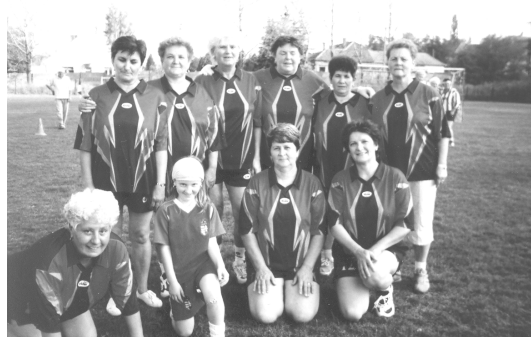
Tokodaltáron fociztunk, és győztünk