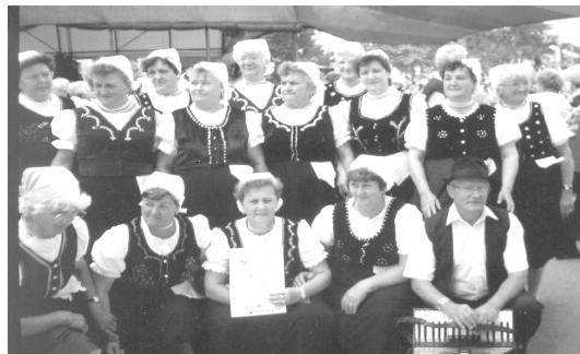
Énekkarunk a cserkeszölői nyugdíjastalálkozón