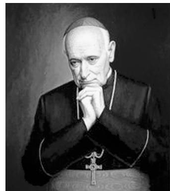
Mindszenty József hercegprímás, bíboros

Így volt szerencsém találkozni a sok szenvedést megélt, híveitől elzárt Mindszenty József Bíboros Úrral.