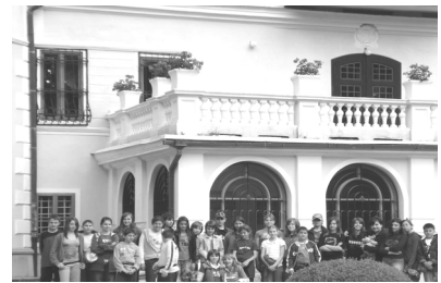
Csoportkép a betléri kastély előtt

Támogatóink: Oktatási Minisztérium, A Magyarországi Nemzeti és Etnikai Kisebbségekért Közalapítvány, Országos Szlovák Önkormányzat, Sárísáp Község Önkormányzata, Sárísápi Szlovák Önkormányzat „A sárísápi gyermekek jövőjéért” Alapítvány.